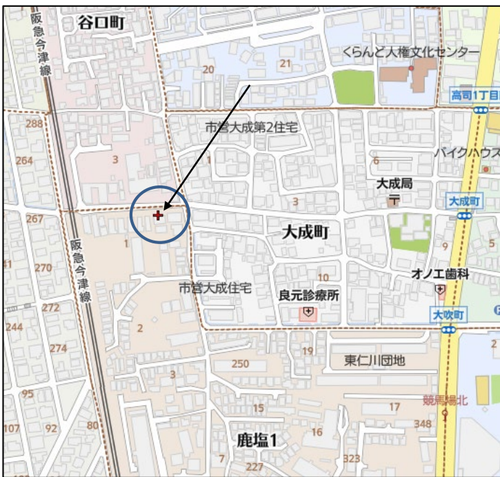
間取り図・敷地図・写真は参考につき現況優先